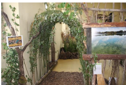
Photo 6 : L'ambiance et le décor de l'exposition photo a plongé les visiteurs au cœur de la réserve de la Bassée.

La réserve donne également rendez-vous régulièrement aux passionnés de nature par le biais d'un programme d'animations. Au cours des 5 animations de ce premier semestre, ce sont près de 70 personnes qui sont venues découvrir la réserve à travers différentes thématiques (faune, flore, zones humides,...). Ces sorties "nature" sont accessibles dès le plus jeune âge, ce sont d'ailleurs les enfants qui ont pris les choses en main quand il a fallu aller à la recherche des amphibiens ! Ils ont ramené les animaux à l'animateur pour qu'il les aide à les identifier.