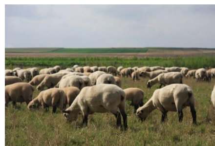
Photo 5 : Le pâturage ovin de développe sur la réserve depuis 2012.

L'expérience du pâturage des bœufs des Ormes-sur-Voulzie a montré l'efficacité que peuvent avoir ces animaux et a servi d'exemple. La réserve est en train de développer divers autres projets de pâturage bovin.