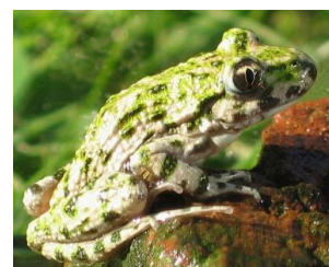
Photo 2 : Le chant du Pélodyte ponctué a été entendu sur la réserve pour la première fois en 2014.

Comme tous les ans, les agents de la réserve assurent un suivi de la faune et de la flore du territoire car pour les protéger, il faut les connaître. Les amphibiens (grenouilles, crapauds et tritons) sont étudiés dès la fin de l'hiver et pour la première fois en 2014, le Pélodyte ponctué (un crapaud) est entendu sur la réserve (étang de Neuvry). Cette espèce était déjà connue en limite de réserve naturelle, sur l'ancienne carrière de Neuvry. Nos suspicions qu'elle utilisait les boisements de la réserve pour hiverner, mais les chants entendus sur les prairies de la commune de Jaulnes nous ont permis de confirmer sa présence. Jusqu'à la fin de l'été, les agents recenseront également les oiseaux, les libellules, les papillons et les plantes présentes sur la réserve.